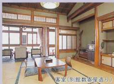
客室(別館数寄屋造り)